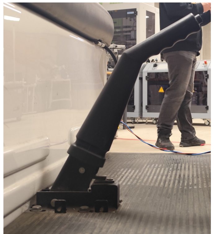
Desactivado (abajo) - Interruptor Abierto